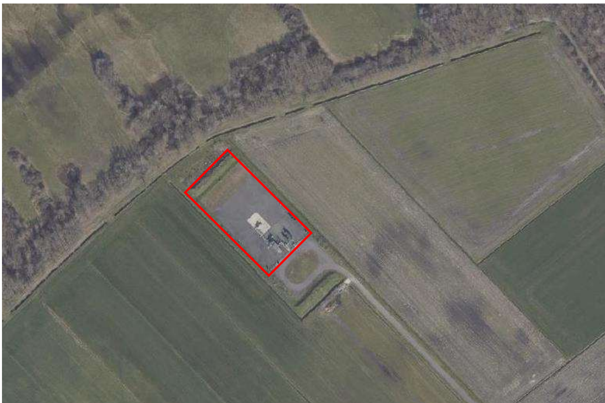
Figuur 1. Weergave planlocatie binnen omheining mijnbouwlocatie Wapse (rood omkaderd) t.o.v. omgeving.

Vermilion Energy Netherlands B.V. is voornemens in 2022 een tweetal diepboringen (LDS-01 en LDS-02) uit te voeren op de mijnbouwlocatie Wapse aan de Noordenveldweg ten noordwesten van het dorp Wapse (gemeente Westerveld) (figuur 1). Voorafgaand aan de boringen vinden er op de locatie diverse grootschalige werkzaamheden plaats ter voorbereiding op de daadwerkelijke boringen.