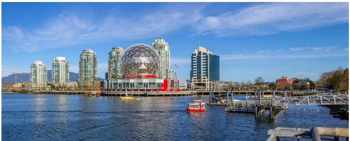
Vancouver, Canada

Dit overzicht is gemaakt in opdracht van het Ministerie van Buitenlandse Zaken.