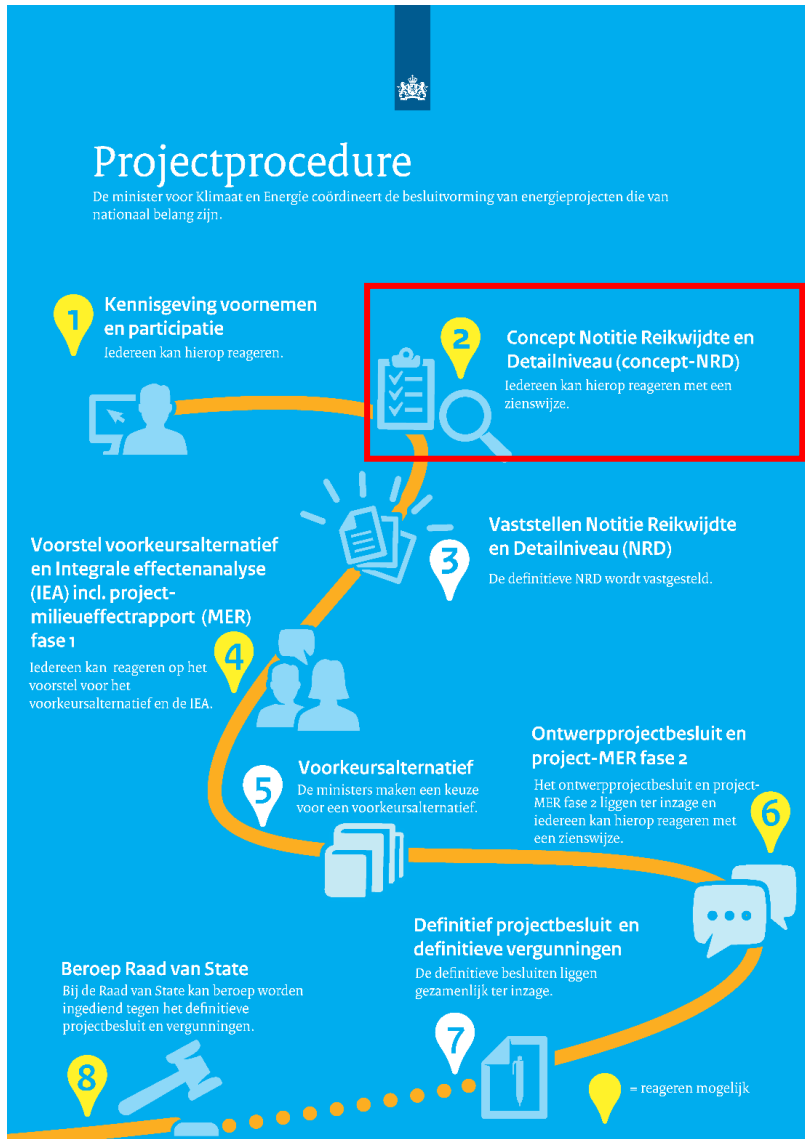
Figuur 2. Stappen in de projectprocedure

In figuur 2 ziet u de stappen in de projectprocedure. Op verschillende momenten zijn er inspraakmogelijkheden. Tijdens deze momenten wordt informatie gedeeld met de omgeving en belanghebbenden en kunt u een reactie en/of zienswijze indienen.