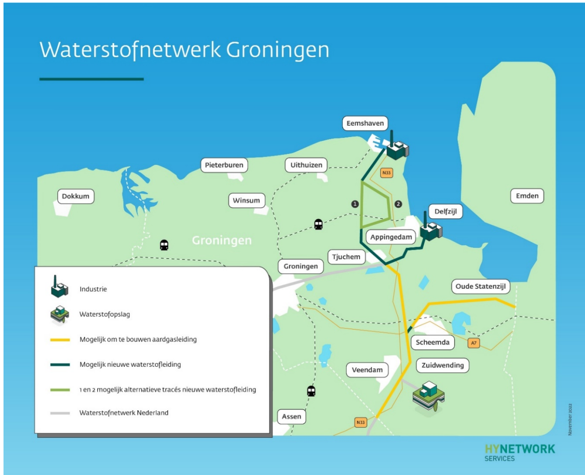
Figuur 1. Afbeelding van het Waterstofnetwerk Groningen