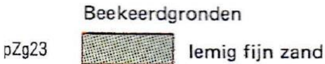
Figuur 3: Bodem in Oolde en met “X” zijn aangegeven de twee percelen van de reeds bestaande wijngaard van Wijngoed Gelders Laren