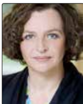
Edith Schippers Minister of Health, Welfare and Sport