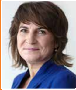
Lilianne Ploumen Minister for Foreign Trade and Development Cooperation

Trade and investment between the Russian Federation and the Netherlands is characterised by growing figures and positive trends. Figures, however, are just numbers. What lies behind those numbers is the two countries' business communities: companies that come together to carry out joint projects and entrepreneurs who take the initiative to engage with international partners.