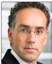
Paul Huijts Director-General for Public Health

PO Box 20350 NL-2500 EJ The Hague E: minister@minvws.nl www.government.nl/ministries/vws