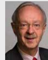
Cor van Honk Consul General

Avenida Brigadeiro Faria Lima, 1779 Jardim Paulistano São Paulo - SP - Brazil 01.452-001 P: +55 11 3811 3300 E: sao@minbuza.nl www.nederlandwereldwijd.nl/landen/brazilie/ over-ons/consulaat-in-sao-paulo