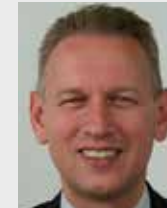
Han Peters Ambassador

SES - Avenida das Nações - Quadra 801 Lote 05 Asa Sul Brasília - DF - Brazil 70.405-900 P: +55 61 3961 3200 E: bra@minbuza.nl www.nederlandwereldwijd.nl/landen/brazilie/ over-ons/ambassade-in-brasilia