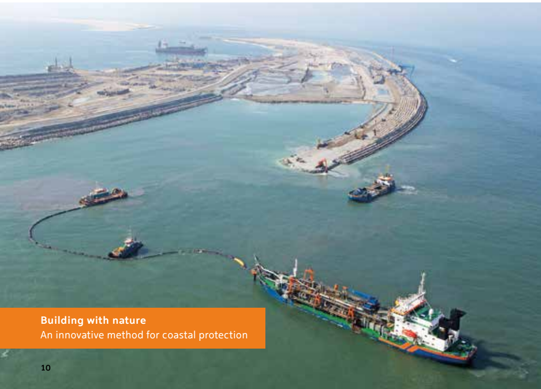
Building with nature An innovative method for coastal protection

pragmatic and open to new challenges, the Dutch have created a flourishing and resilient land. The Netherlands is a constantly evolving ecosystem of cities, industry, agriculture and nature, all integrated through smart infrastructure. It is a source of knowledge and experience that the Dutch are keen to share with others. Learning from the past to create a better future. Together, seeking sustainable solutions for the most liveable world.