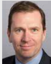
Bas van den Dungen Vice-Minister Health

PO Box 20350 NL-2500 EJ The Hague www.government.nl/ministries/vws