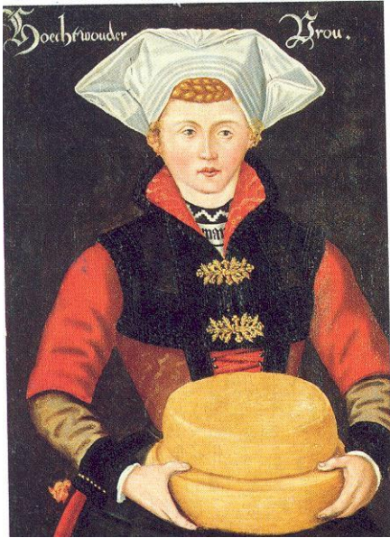
Gouda Holland in de 16 e eeuw (schilderij uit circa 1570 van een vrouw uit Hoogwoud, provincie Noord-Holland)

Alleen al in Gouda werd in de tweede helft van de Gouden Eeuw jaarlijks ongeveer 5 miljoen pond kaas aangevoerd op de markt. De kaashandel was zo belangrijk voor de stad dat de bekende bouwmeester Pieter Post werd aangetrokken voor een monumentaal Waaggebouw (1667) tegenover het stadhuis.