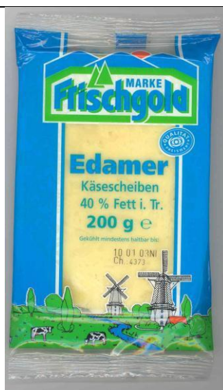
Voorverpakte Edam in Duitse supermarkt, najaar 2002