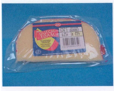
Franse Edam met aanduiding "Dutch" in Makro, Coventry, UK, februari 2002