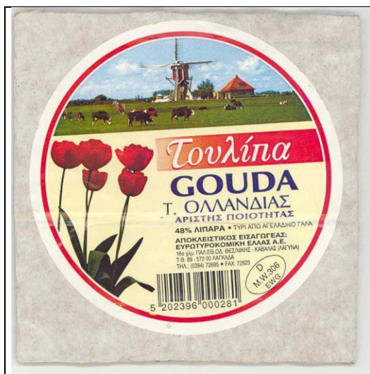
Etiket met Nederlandse tulpen en molens op Duitse Gouda in Griekenland