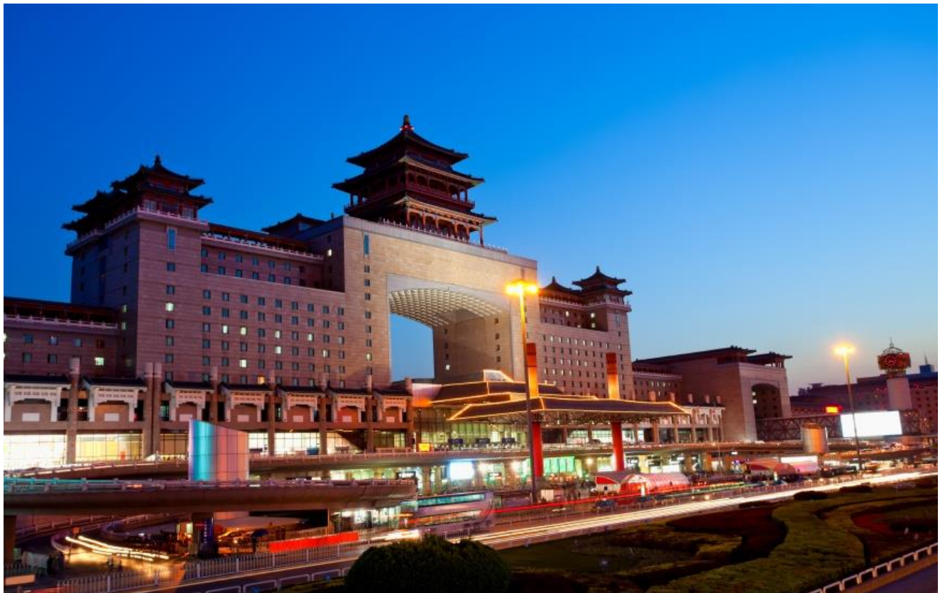
Beijing West treinstation, China

Dit overzicht is gemaakt in opdracht van het Ministerie van Buitenlandse Zaken.