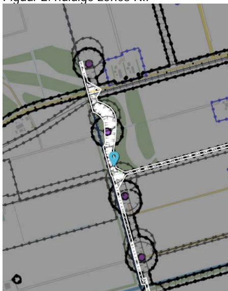
Figuur 2: huidige zones RIP

Het vastgestelde RIP wijst turbinelocaties aan met een overdraaicontour. Binnen deze contour kan een kraanopstelplaats aangelegd of gebouwd worden. De kraanopstelplaats moet logischerwijs aansluiten op de turbinelocatie. Tevens zijn in het RIP zones opgenomen voor de ligging van kabels en parkwegen. Ter hoogte van archeologisch monument 532464 volgen de zones voor kabels en parkwegen in het huidige RIP het grasland. Dit is echter een oorspronkelijke oeverwal met de hoogste archeologische verwachtingswaarde en dus is het onwenselijk voor de RCE om hier wegen en kabels aan te leggen. Het huidige RIP is weergegeven in onderstaande figuur 2.