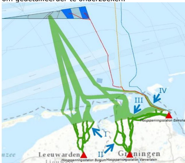
Figuur 4: Kaart met de vier toegevoegde alternatieven

In juli en augustus 2019 hebben we alle bij ons bekende en ingebrachte informatie verder verwerkt. De brede zoekgebieden zijn daar waar mogelijk versmald naar 'lijnen' (tracéalternatieven), zodat deze een stap concreter worden. Vervolgens is er door het ministerie van EZK op basis van de traceringsuitgangspunten zoals genoemd in de concept-NRD gekozen welke van de tracéalternatieven naar de drie mogelijke aansluitlocaties (hoogspanningsstations in Eemshaven, Vierverlaten of Burgum) mee gaan in de concept-NRD (zie paragraaf 2.1 figuur 1).