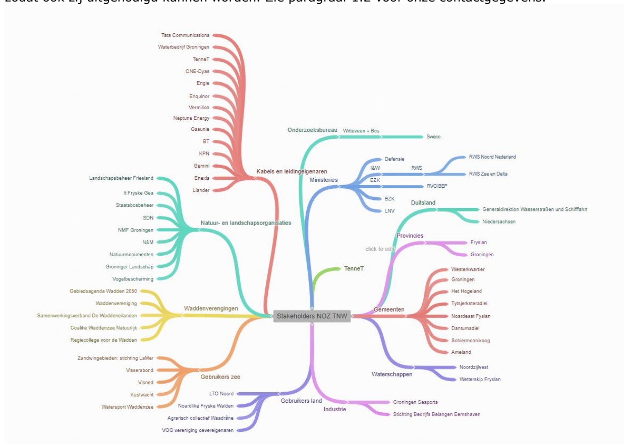
Figuur 3: Overzicht van uitgenodigde organisaties voor werksessies

Naast overleggen op ambtelijk en bestuurlijk niveau met de bevoegde gezagen (ministeries, gemeenten, provincies, Rijkswaterstaat en waterschappen) zijn werksessies georganiseerd met de bevoegde gezagen en belanghebbende partijen op zee en op land. De verslagen van deze werksessies kunt u vinden op: www.netopzee.eu/tennoordenvandewaddeneilanden/overige-pagina-s/publicaties . We hebben de bij ons bekende belangenorganisaties uit de regio uitgenodigd. Onderstaand vindt u een overzicht van deze organisaties. Ook in het vervolgproces organiseren wij bijeenkomsten. Mocht u van mening zijn dat er organisaties ontbreken dan vernemen wij dit graag, zodat ook zij uitgenodigd kunnen worden. Zie paragraaf 1.2 voor onze contactgegevens.