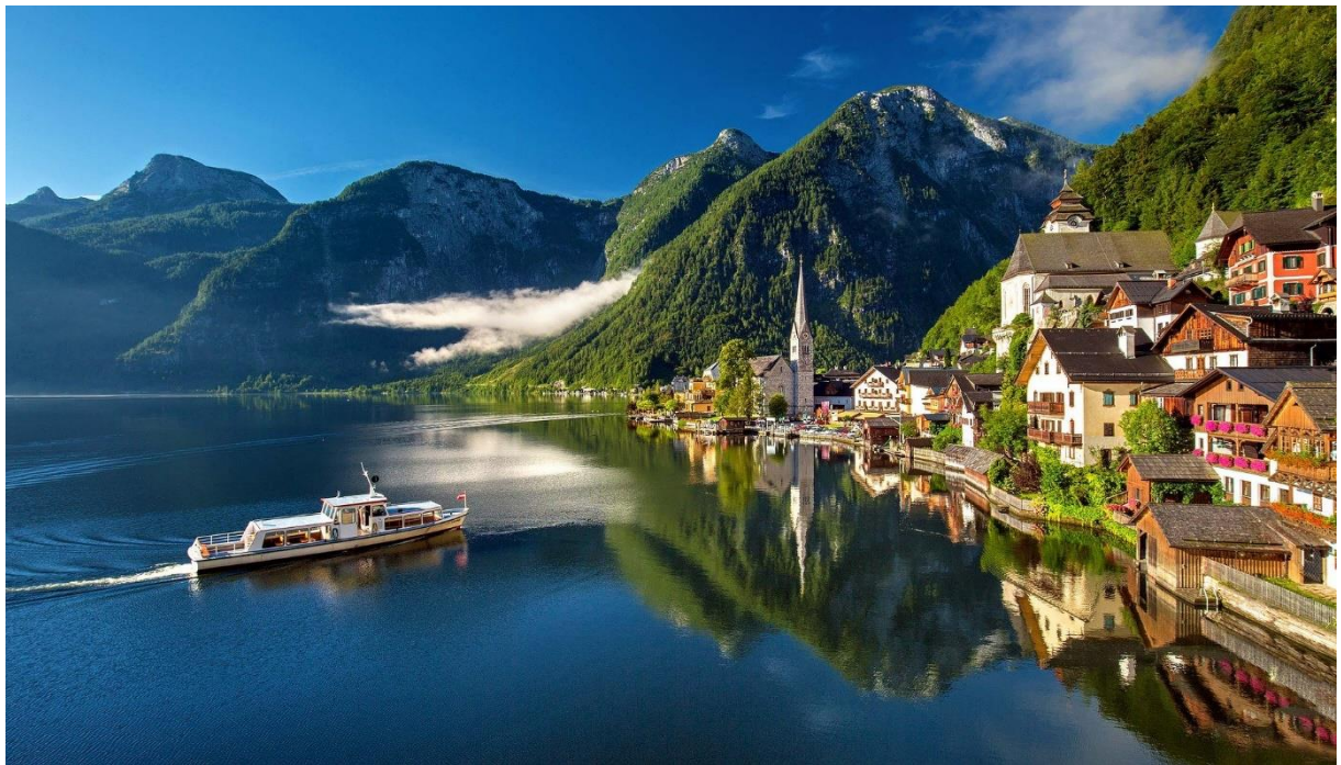
Hallstatt, Oostenrijk

Dit overzicht is gemaakt in opdracht van het Ministerie van Buitenlandse Zaken.