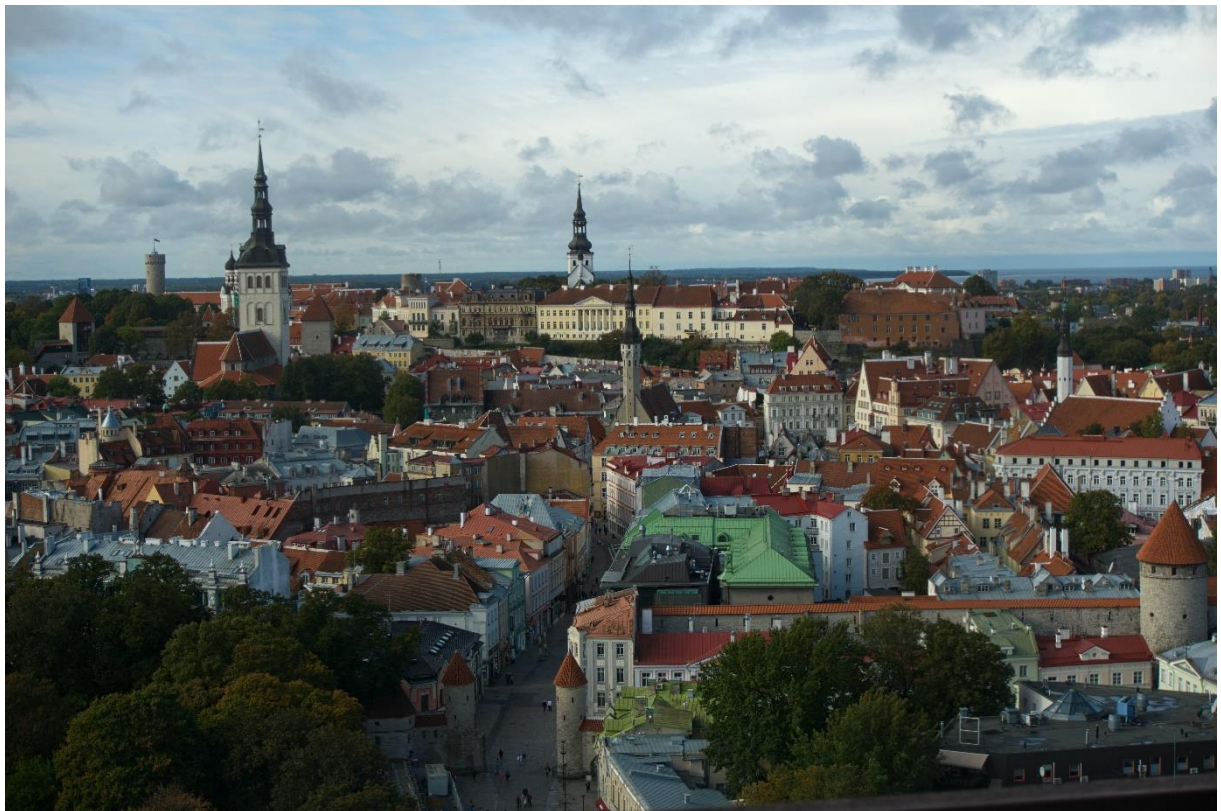
Tallinn, Estland

Dit overzicht is gemaakt in opdracht van het Ministerie van Buitenlandse Zaken.