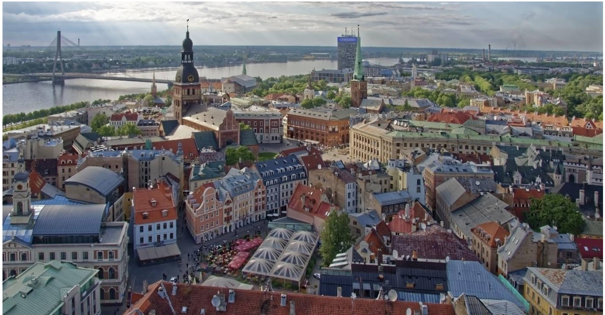
Riga, Letland

Dit overzicht is gemaakt in opdracht van het Ministerie van Buitenlandse Zaken.