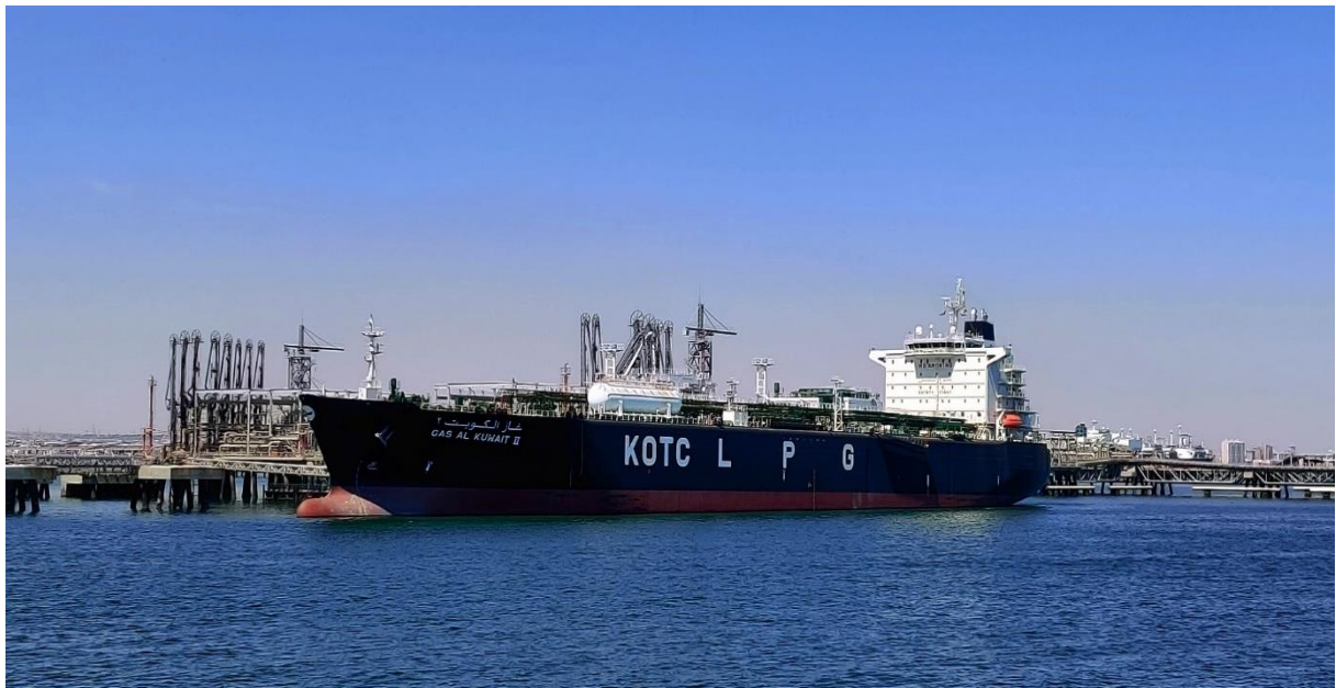
Tanker Koeweit

Dit overzicht is gemaakt in opdracht van het Ministerie van Buitenlandse Zaken.