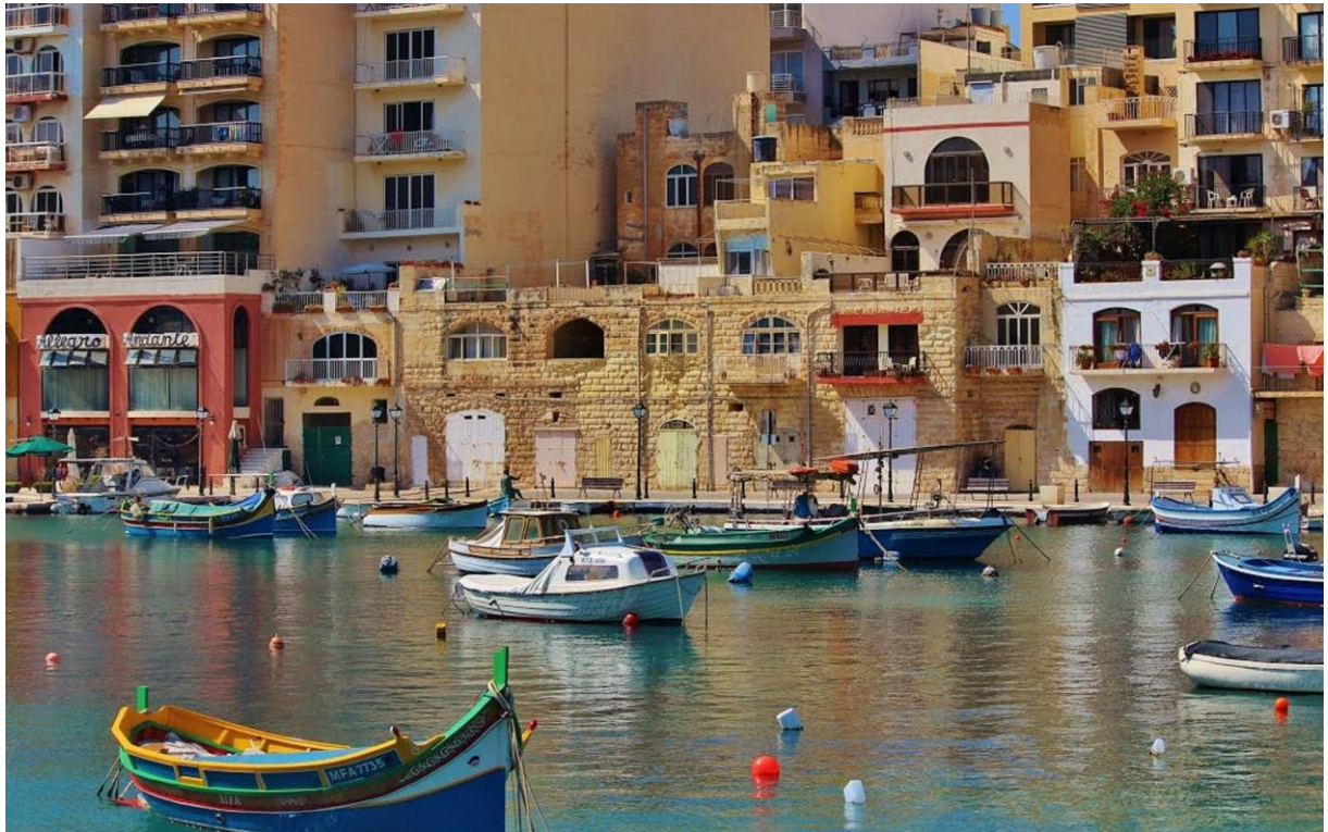
Haven, Malta

Dit overzicht is gemaakt in opdracht van het Ministerie van Buitenlandse Zaken.