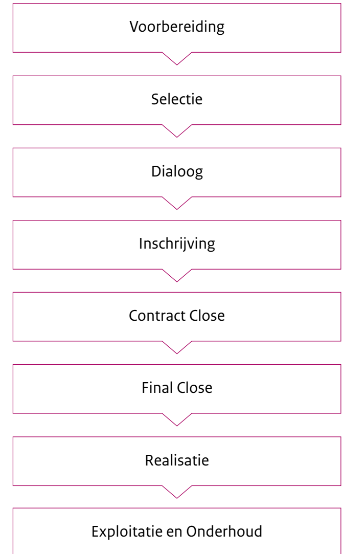
FIGUUR 1 STAPPEN IN CONCURRENTIEGERICHTE DIALOOG