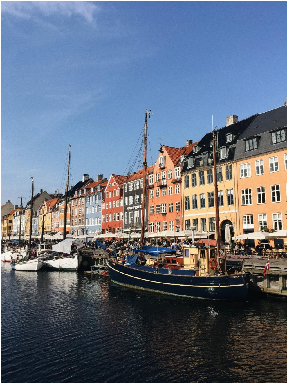
Nyhavn in Kopenhagen, Denemarken

Dit overzicht is gemaakt in opdracht van het Ministerie van Buitenlandse Zaken.