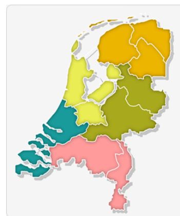
Figuur 1 Indeling grondkamers

De taken vloeien voort uit de wet- en regelgeving op het terrein van het pachtrecht: Uitvoeringswet Grondkamers, Uitvoeringsbesluit Pacht en Uitvoeringsregeling Pacht en de Wet Inrichting Landelijk gebied.