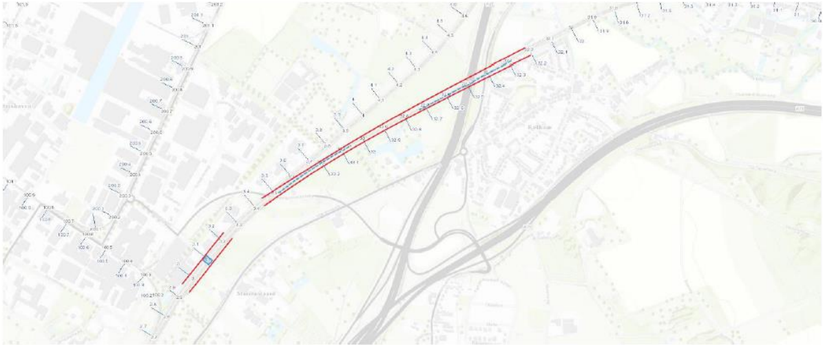
Figuur 1 Ligging kabeltracé deelgebied 1 en de overweg met indicatieve lengte schermen