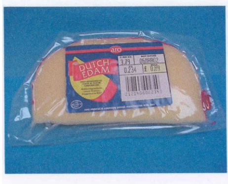
Franse Edam met aanduiding "Dutch" in Makro, Coventry, UK, februari 2002