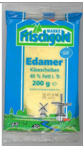
Voorverpakte Edam in Duitse supermarkt, najaar 2002