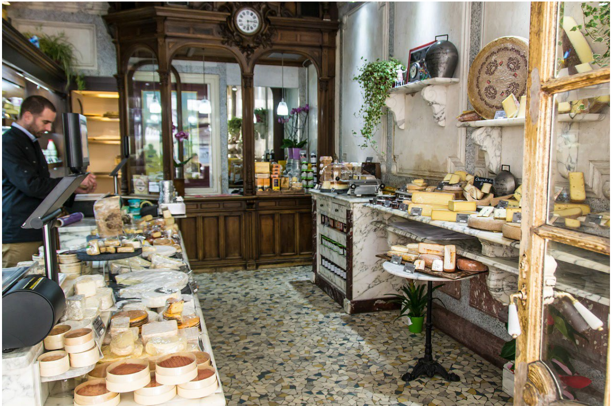
Kaaswinkel, Frankrijk

Dit overzicht is gemaakt in opdracht van het Ministerie van Buitenlandse Zaken.