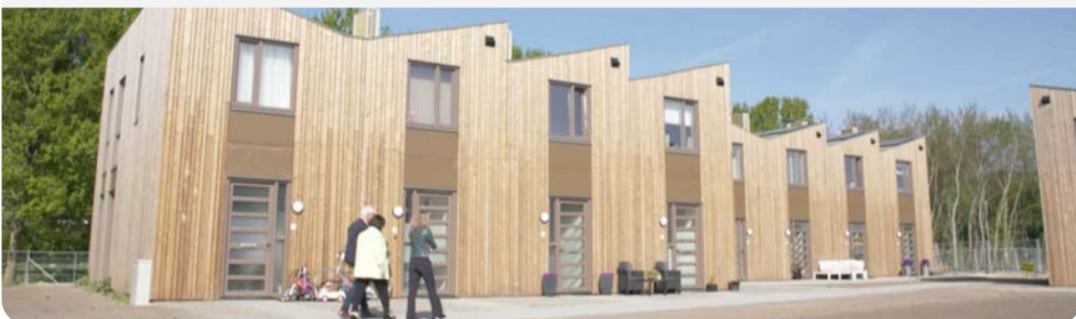
Realisatie Flexwoningen Eindhoven. Klik op de afbeelding voor de video van het project.

Het Expertteam Woningbouw hielp de gemeente Eindhoven in Buurtschap te Veld met het versneld realiseren van 700 woningen door tijdelijke woningbouw.