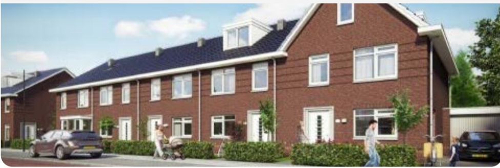
Versneld bouwen in de gemeente Hardenberg

Het Expertteam Woningbouw organiseert versnellingskamers markt-overheid. Het doel is de samenwerking tussen marktpartijen en gemeenten versterken en de woningbouw versnellen. In deze kamers krijgen marktpartijen gelegenheid om samen met de gemeenten en experts te sparren over een (vastgelopen) woningbouwproject. In september volgt een drietal webcasts over de geleerde lessen.