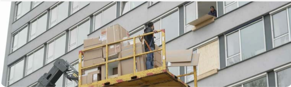
Transformatieproject in Leiden. Klik op de afbeelding voor de video van het project.

Het Expertteam Woningbouw helpt de gemeente Leiden versneld huisvesting te realiseren voor verschillende doelgroepen. Onze experts bieden inzicht in de (financiële) haalbaarheid van voorgenomen gebouwtransformaties op 4 locaties. Bekijk het verhaal .