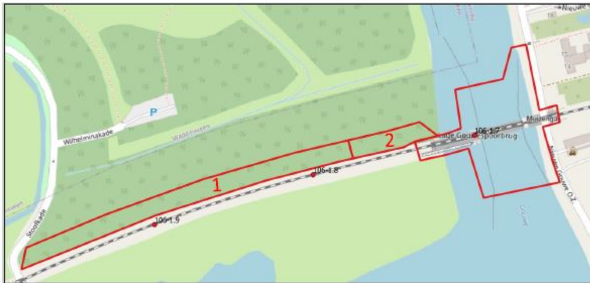
Figuur 3. Impressie van het projectgebied (1 – werkweg en 2 – werkkerrein).