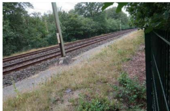
INF 25 mei 2022 Figuur 3. Foto's van project locatie.