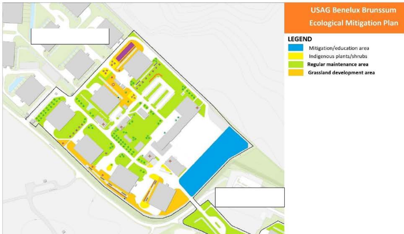
Figuur 6: Mitigatieplan USAG Benelux Brunssum centraal.