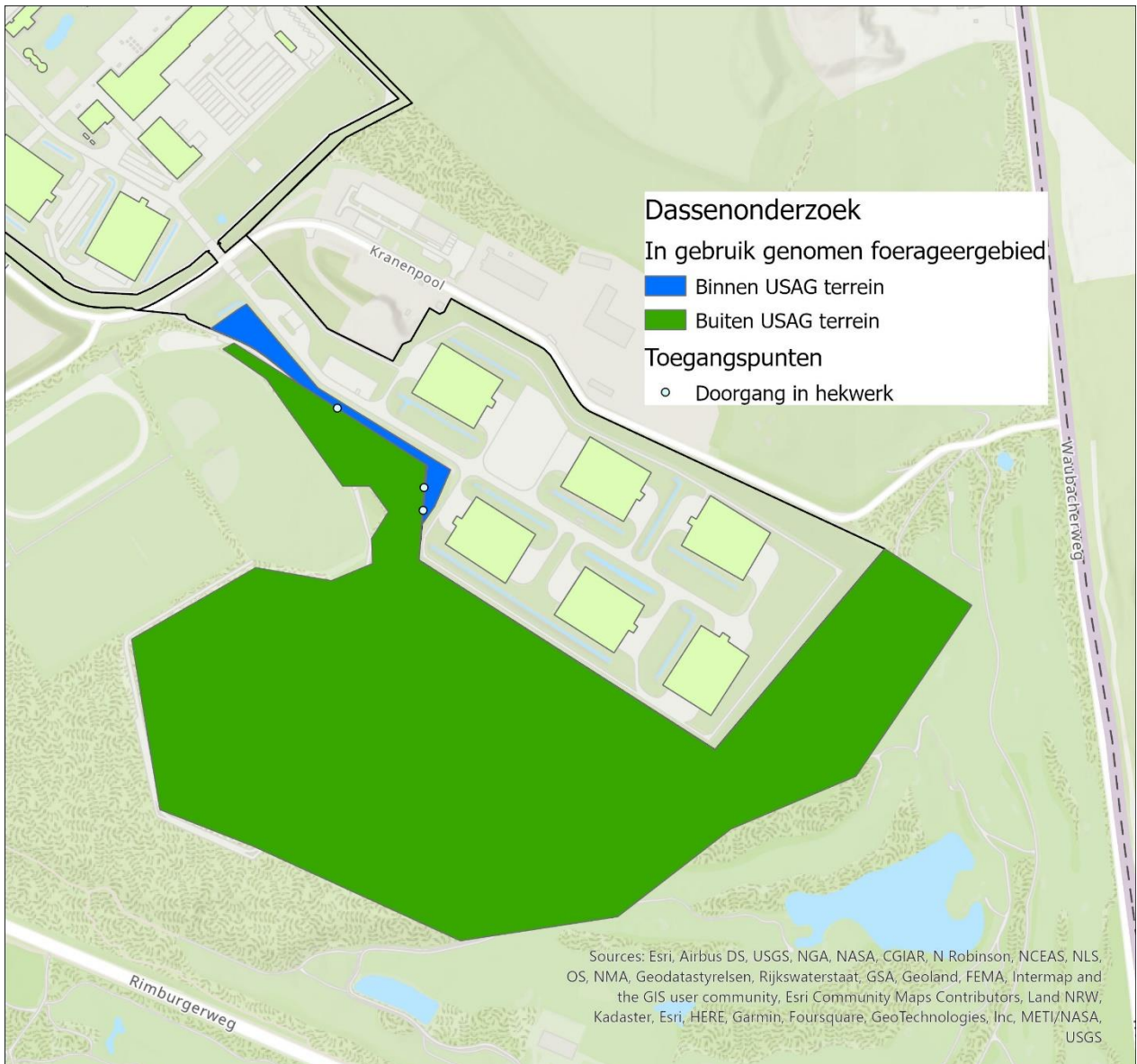
Figuur 4: Resultaten dassenonderzoek. Met voldoende dekking binnen de ingebruik genomen foerageergebieden.