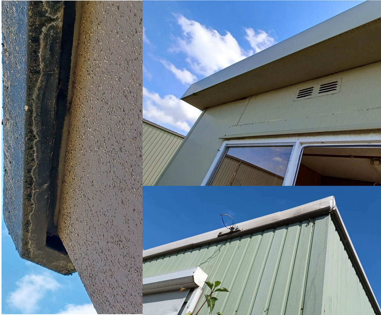
Figuur 3: De overige gebouwen zijn ook volledig tot aan het dak afgewerkt.