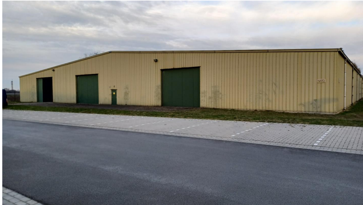
Figuur 1: Een van de metalen loodsen binnen het plangebied. De metalen loodsen zijn tot aan het dak afgewerkt en bevatten een enkele ijzeren plaat als zijwand. Er zijn geen geschikte holtes voor de gierwaluw aangetroffen.