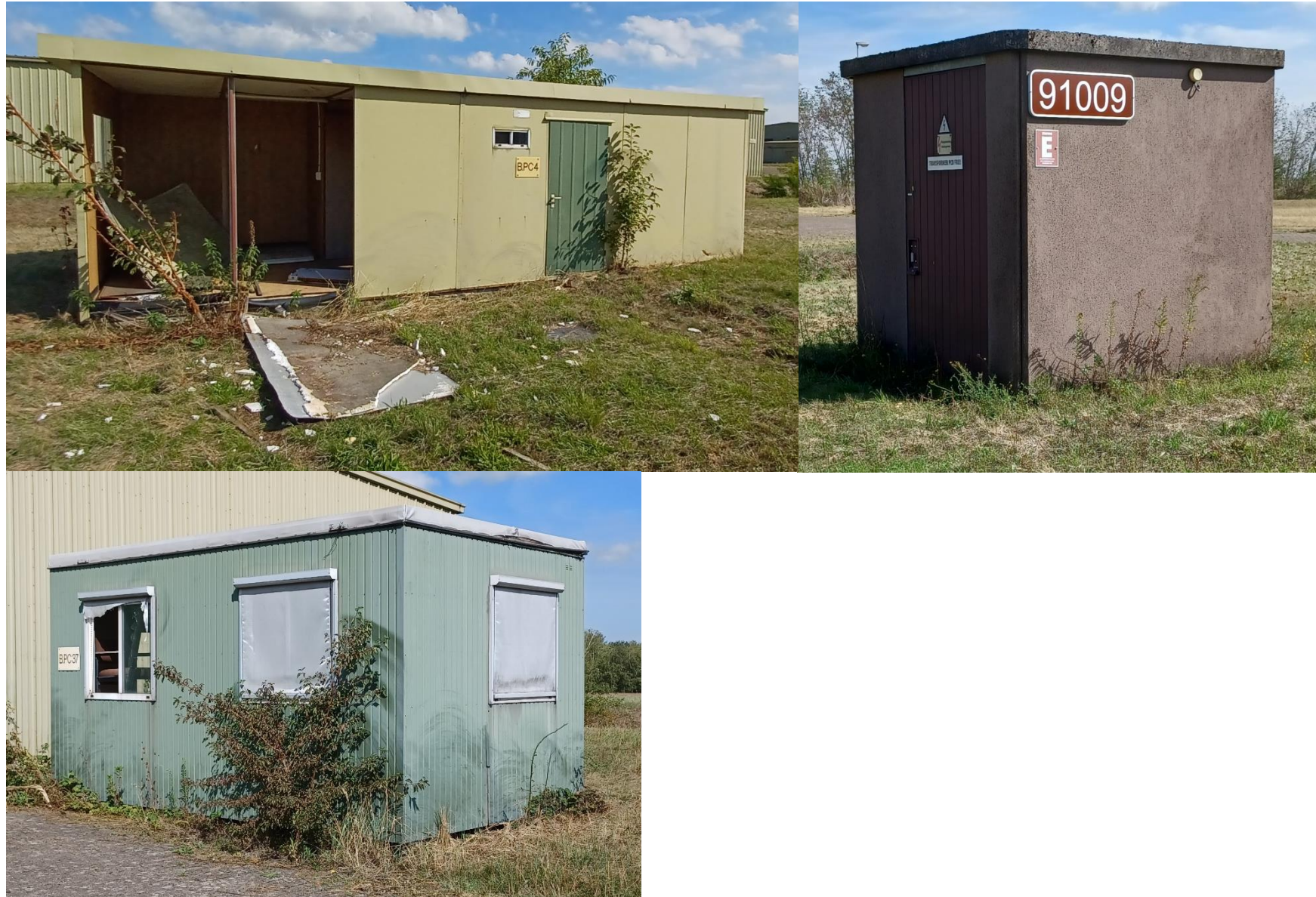
Figuur 2: De overige aanwezige gebouwen. Deze gebouwen zijn maximaal 2.5m hoog en ook hier zijn geen geschikte invliegopeningen voor de gierwaluw aangetroffen.