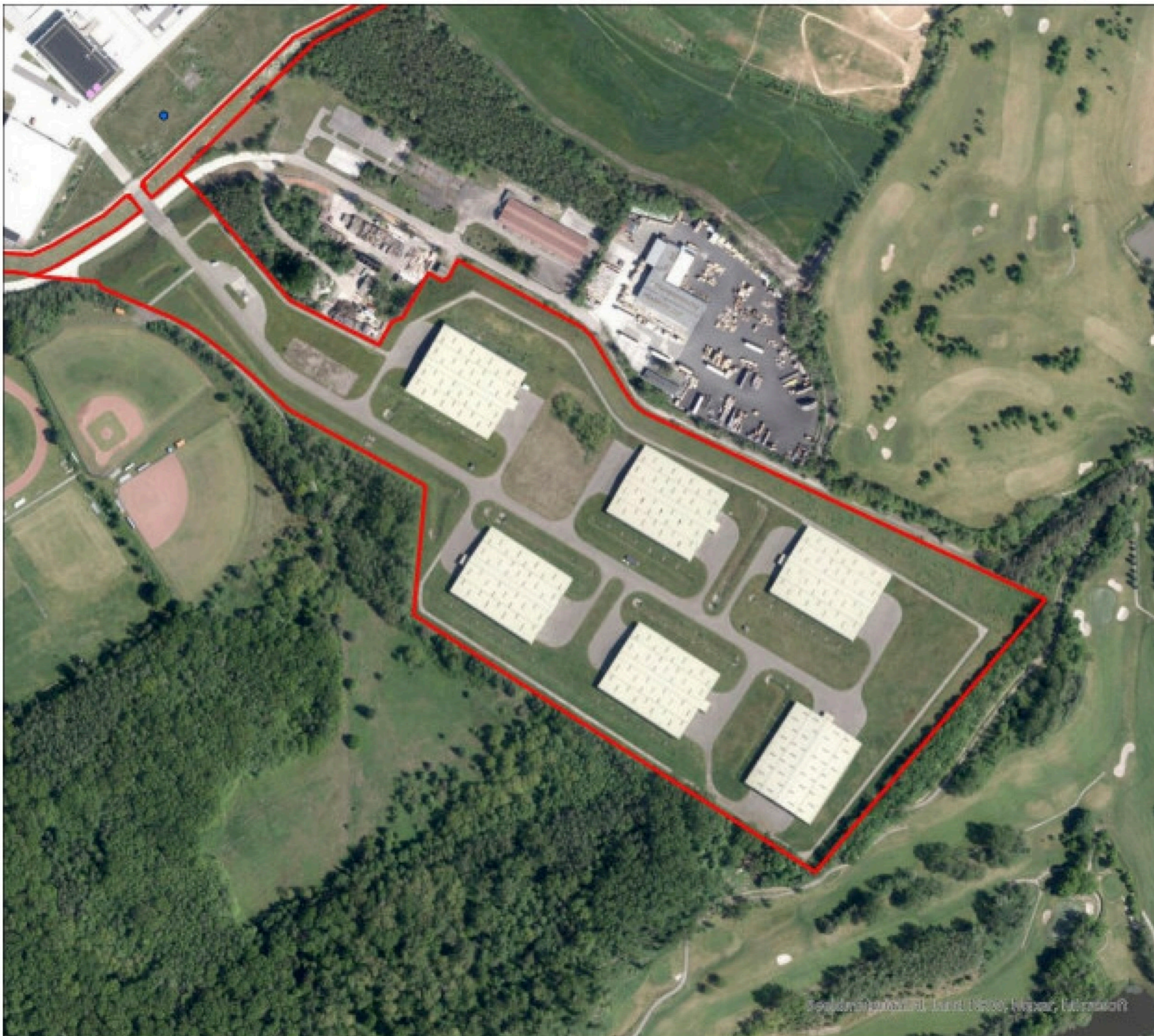
Figuur 1 Luchtfoto plangebied (25-03-2020)