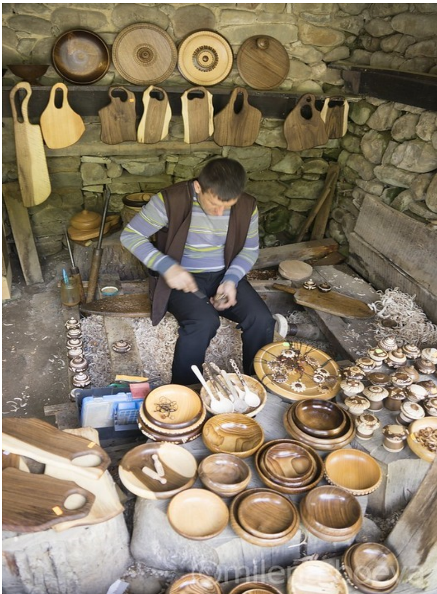
Bulgarije

Dit overzicht is gemaakt in opdracht van het Ministerie van Buitenlandse Zaken.