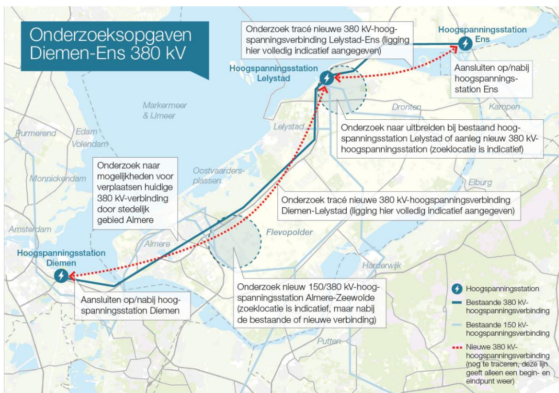
Figuur 1 De onderzoekopgaven voor het project 380 kV-hoogspanningsverbinding Diemen - Ens

In figuur 1 zijn de verschillende onderdelen van de opgave weergegeven. De verschillende onderdelen zijn uitgebreid beschreven in de Nota Onderzoeksalternatieven.