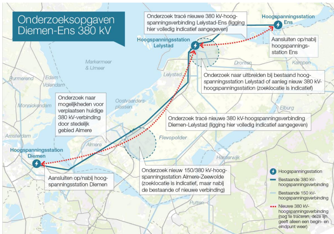
Figuur 1 De onderzoekopgaven voor het project 380 kV-hoogspanningsverbinding Diemen - Ens

In figuur 1 zijn de verschillende onderdelen van de opgave weergegeven. De verschillende onderdelen zijn uitgebreid beschreven in de Nota Onderzoeksalternatieven, welke als bijlage bij de Notitie Reikwijdte en Detailniveau is opgenomen.