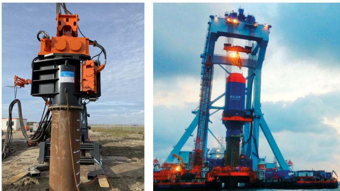
Figuur 4-3. Links: Gentle Pile Driving. Bron: /grow-offshorewind.nl/project/gentle-driving-of-piles en rechts: Blue Piling Bron: www.iqip.com .

Blue piling is een nieuw ontwikkelde installatietechniek (Figuur 4-3, rechts). Bij de BLUE Piling-technologie wordt gebruik gemaakt van een grote waterkolom om een paal in de grond te heien. De waterkolom wordt omhoog gestoten door de verbranding van een gasmengsel. Deze waterkolom drukt de paal tijdens het omhoog springen omlaag en bij het neervallen van de waterkolom gaat de paal nog verder de zeebodem in. Dit wordt herhaald tot de paal de gewenste diepte bereikt heeft. Dit zorgt voor minder geluidsoverlast, omdat er sprake is van een lang uitgesmeerde klap. Het bedrijf IQIP claimt dat een geluidsreductie van meer dan 20 dB in vergelijking met conventionele heihammers mogelijk moet zijn ( https://iqip.com/wp-content/uploads/2021/12/Leaflet-BLUE-Piling-Technology.pdf ). De technologie is echter nog niet op volle zee getest.