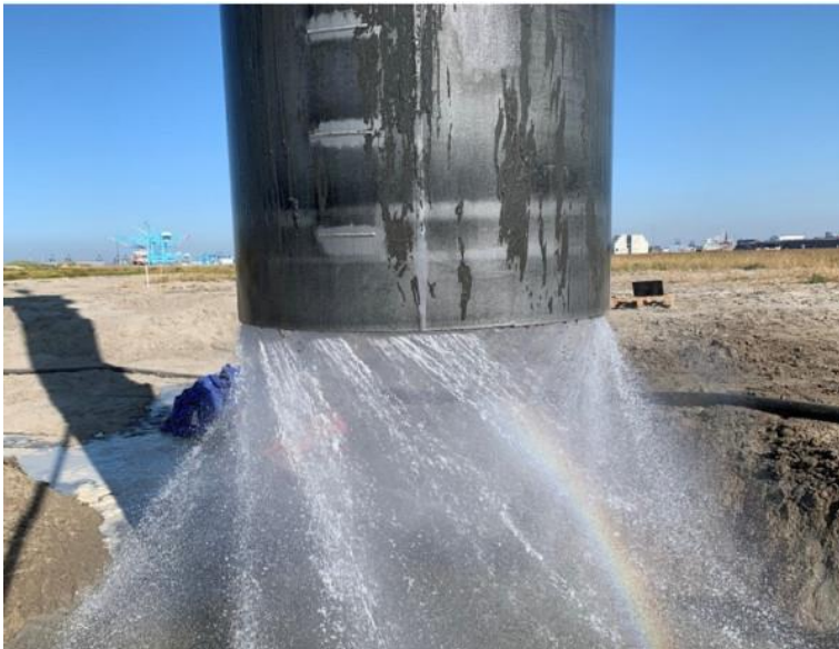
Figuur 4-2. Jetting.

Vibrojetting is een techniek waarbij tijdens het intrillen van de paal de bodem vloeibaarder wordt gemaakt door deze te injecteren met een sterke waterstraal (Figuur 4-2). De combinatie van deze twee technieken zorgt ervoor dat de weerstand van de grond zodanig verlaagd wordt dat de paal door eigen gewicht in combinatie met op de paal aangebrachte trillingen makkelijker de bodem in gaat (zie www.gbmworks.com/projects voor een filmpje van de installatie van een paal op Maasvlakte 2). Het is de bedoeling om binnen het SIMPLE-III-project deze techniek op zee te testen, waarbij de nodige technische en milieukennis wordt verzameld, waaronder gegevens over onderwatergeluid (zie verder https://www.grow-offshorewind.nl/project/silent-installation-of-monopiles-iii-simple-iii ).