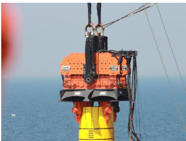
Figuur 4-1. Trilhamer.

Trillen. Op de paal wordt een zogenaamde trilhamer aangebracht die er door trillingen, in plaats van door klappen, voor zorgt dat de paal de grond in zakt (zie Figuur 4-1). In deze trilhamer zitten excentrische gewichten die in tegengestelde richting draaien waardoor de horizontale worden geëlimineerd en alleen verticale trillingen op de paal worden overgebracht. Uit 'worst case' berekeningen voor de MERen Ijmuiden Ver Gamma en Nederwiek I blijkt dat intrillen van een paal minder geluid genereert dan een traditionele hydraulische heihamer.