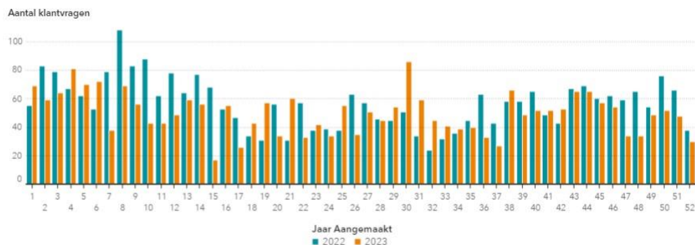
Figuur 3 Klantvragen

Als gevolg van de veranderde werkwijze in 2016 is het aantal vragen hoger geweest dan in de jaren daarvoor. Het betrof vooral vragen over het proces (nieuwe werkwijze) en de doorlooptijd. Vanaf 2017 is het aantal klantvragen weer flink gaan dalen. Vanaf 2019 is het aantal klantvragen stabiel. In 2023 is het totaal aantal klantvragen ten opzichte van 2022 licht gedaald. In onderstaande grafiek wordt het aantal klantvragen per maand weergegeven voor 2023 ten opzichte van 2022.