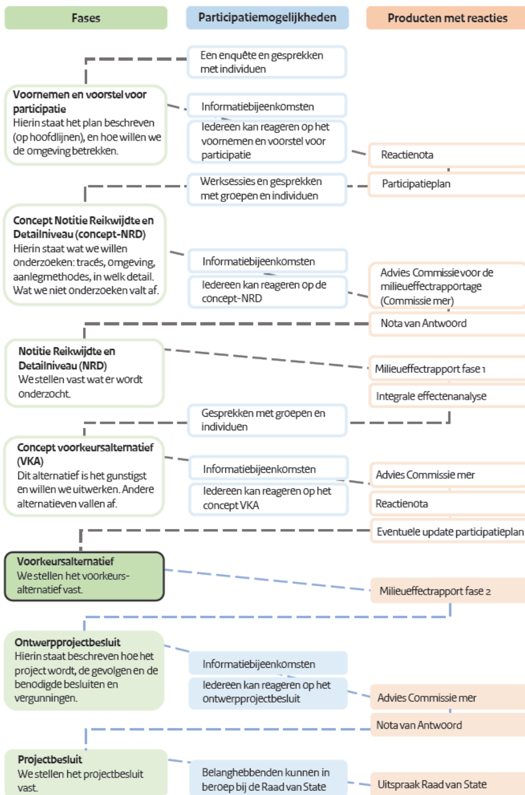
Figuur 2. Samenhang tussen Projectprocedure, m.e.r.-procedure en participatieproces