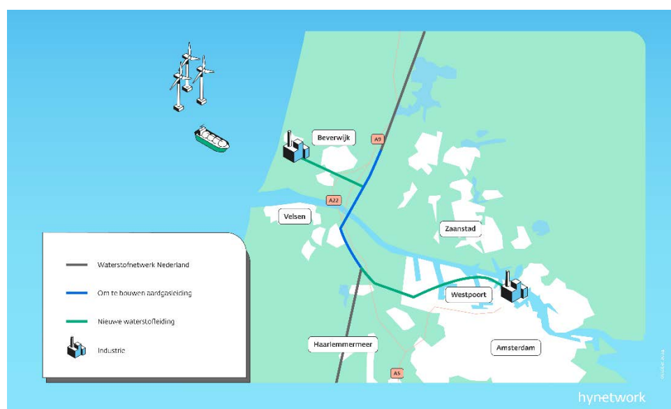
Figuur 1. Tekening van het Waterstofnetwerk NZKG

Deze vraag gaat over hoe het waterstofnetwerk eruitziet en waar het komt te liggen (route). Het waterstofnetwerk in het NZKG is een netwerk van ondergrondse buisleidingen voor het transport van waterstof in de provincie Noord-Holland, van de IJmond-regio naar het Amsterdams havengebied. Dit netwerk is onderdeel van het landelijke waterstofnetwerk. In het Noordzeekanaalgebied zijn de industrie in de IJmond, Schiphol en het Amsterdams havengebied belangrijk voor het maken en gebruiken van waterstof. In figuur 1 ziet u een grafische weergave van het waterstofnetwerk in het NZKG.