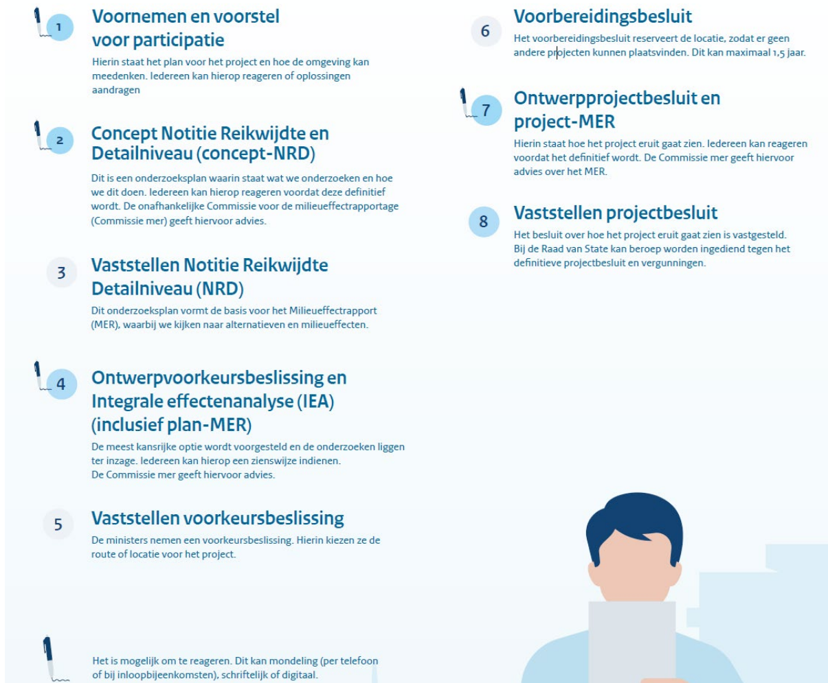
Afbeelding 3 - Overzicht van de stappen in de projectprocedure

We werken stap voor stap naar een definitieve route en locatie voor het hoogspanningsstation. Tijdens het proces kun je op 5 momenten reageren, bijvoorbeeld met een zienswijze of beroep bij de Raad van State. De afbeelding hieronder laat zien wanneer dat kan.