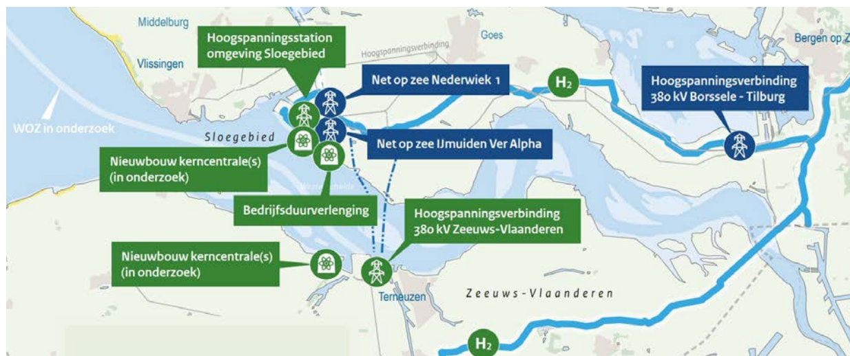
Figuur 1 - Overzicht energieprojecten in Zeeland

Met name met programma VAWOZ en Nieuwbouw Kerncentrales willen we zo integraal mogelijk afstemmen, want daar is kans op overlap en er zijn veel afhankelijkheden. De besluitvorming zal wel per procedure plaatsvinden, onder andere om geen vertraging te veroorzaken.