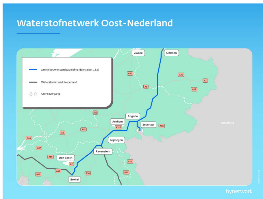
Afbeelding 2.1 Weergave van de leidingen van Waterstofnetwerk Oost-Nederland

Ter hoogte van compressorstation 1 Ommen sluit de leiding aan op de waterstofleiding van het project Waterstofnetwerk Drenthe-Overijssel. Ter hoogte van Boxtel maakt Waterstofnetwerk Oost-Nederland een verbinding mogelijk met de Delta Rhine Corridor (DRC). Op compressorstation 1 Ravenstein sluit het project aan op het Waterstofnetwerk Limburg. In Zevenaar realiseren Duitse netwerkbeheerders een aansluiting op hun netwerk.