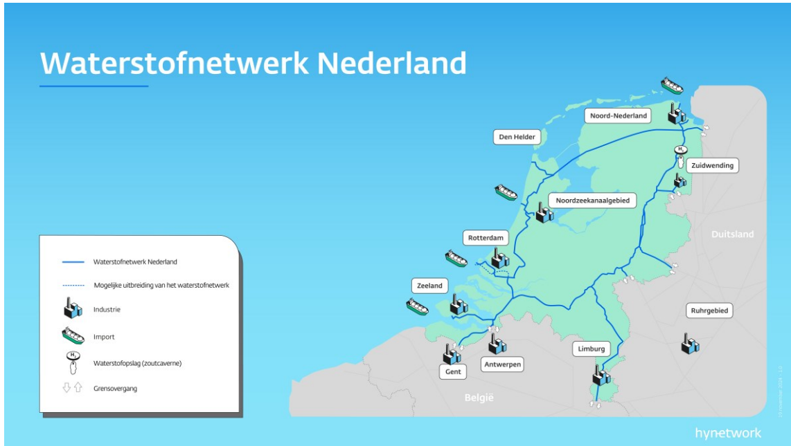
Afbeelding 1.1 Voorgenomen ontwikkeling Waterstofnetwerk Nederland

De realisatie van het waterstofnetwerk gebeurt volgens een landelijk uitrolplan. Het netwerk wordt in vier fasen uitgerold, te beginnen in Rotterdam in 2026 en later uitgebreid naar andere regio's en grensverbindingen: