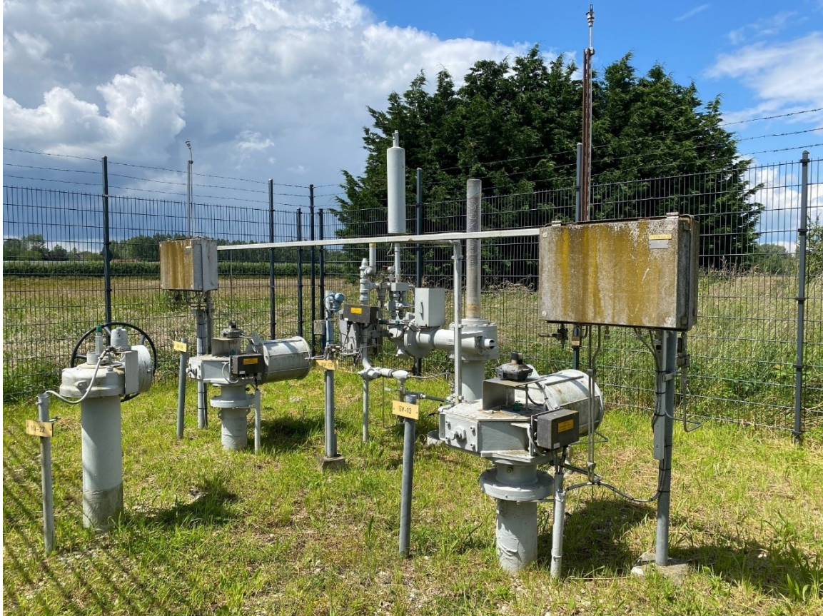
Afbeelding 2.2 Voorbeeld van een afsluiterlocatie

Op de afsluiterlocaties kunnen drie typen werkzaamheden uitgevoerd worden: