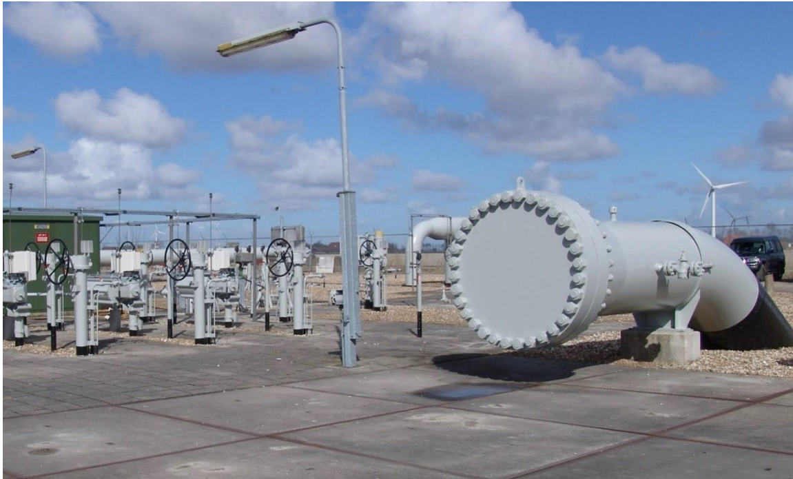
Afbeelding 2.3 Scraper trap (rechts op de foto)

De werkzaamheden staan per werklocatie in onderstaande tabel weergegeven. In sommige gevallen kan het nodig zijn dat bestaande locaties moeten worden uitgebreid om een afsluiterschema of scraper trap mogelijk te maken.