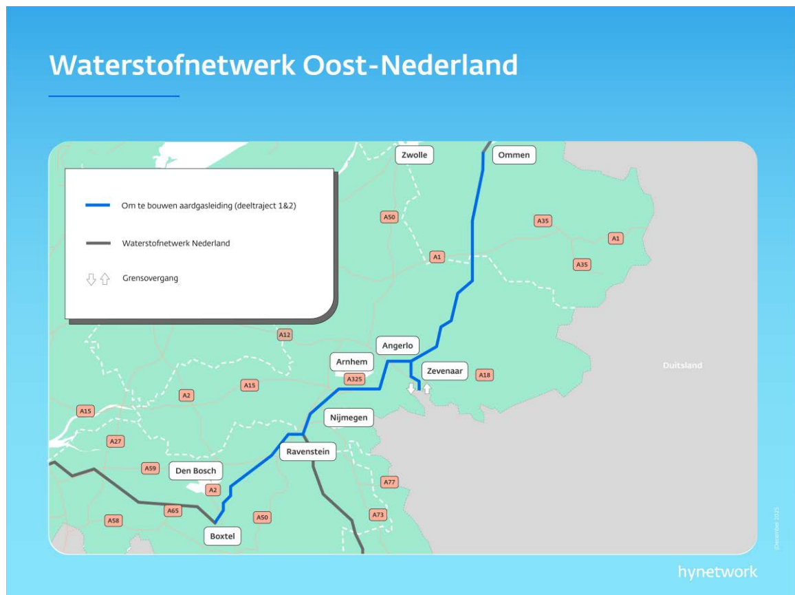
Afbeelding 0.1 Trajecten project Waterstofnetwerk Oost-Nederland

In onderstaande afbeelding zijn deze trajecten weergegeven.