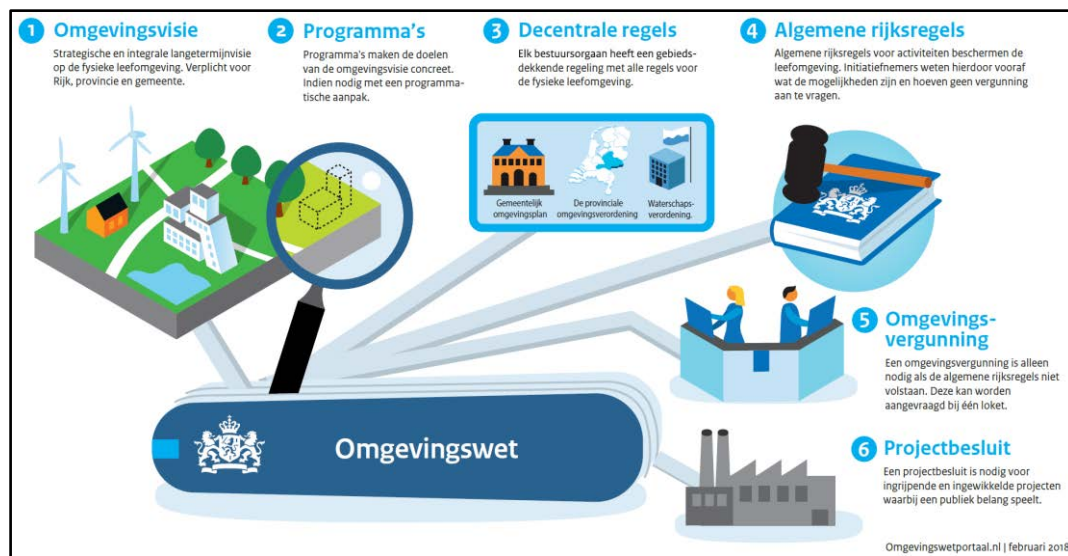
Figuur: zes kerninstrumenten van de Omgevingswet