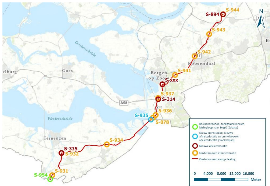
Figuur 6 | Tracédeel Moerdijk - Zelzate 1