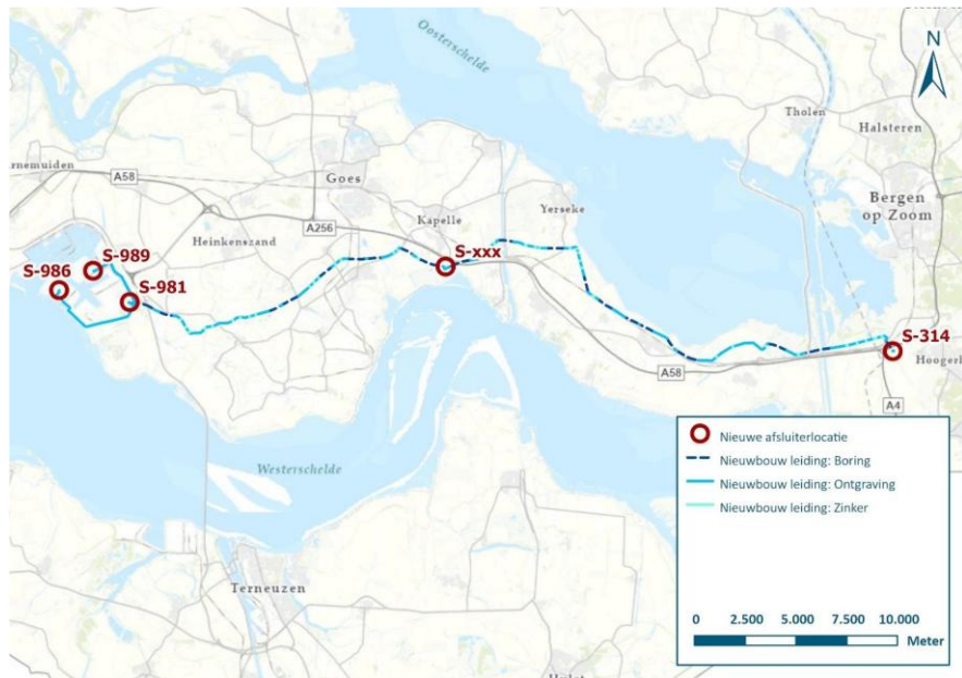
Figuur 7 | Nieuwbouw tracédeel Woensdrecht – Vlissingen 1