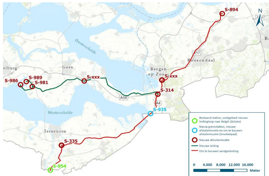
Figuur 1 | Overzichtskaart voorkeursalternatief 1