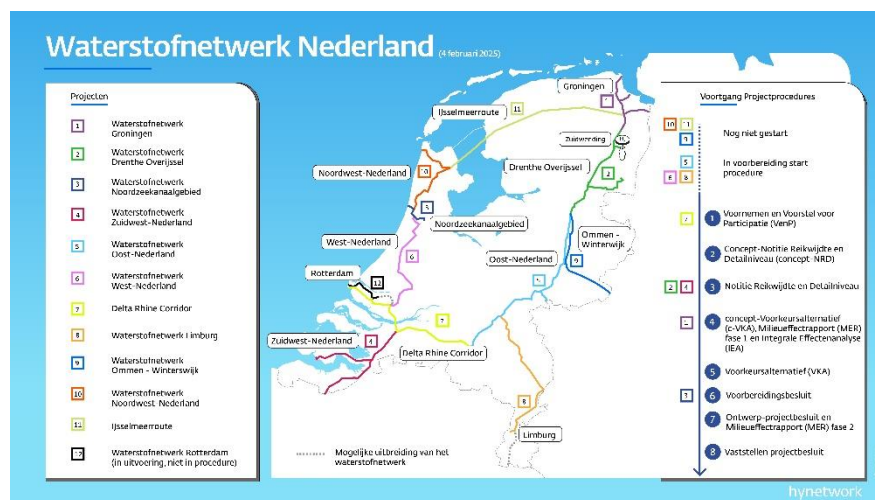
Figuur 4 | Faseringsoverzicht Waterstofnetwerk Nederland

Het is een belangrijke schakel voor de import, productie, opslag en het transport van waterstof. Zowel als regionaal netwerk maar ook als onderdeel van het (inter)nationaal transportnetwerk.