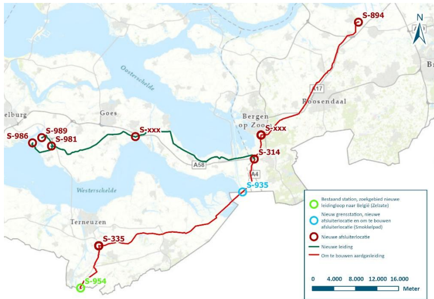
Figuur 5 | Overzichtskaart projectgebied en voorkeursalternatief 1