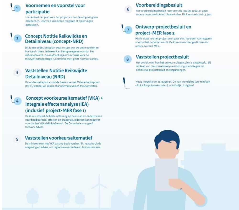
Figuur 8 | Schematische weergave projectprocedure

De Rijksoverheid kan bij projecten van nationaal belang de besluitvorming coördineren. Onder de Omgevingswet wordt de projectprocedure gevolgd. Over energieprojecten besluit de minister van Klimaat en Groene Groei (KGG) samen met de minister van Volkshuisvesting en Ruimtelijke Ordening (VRO).